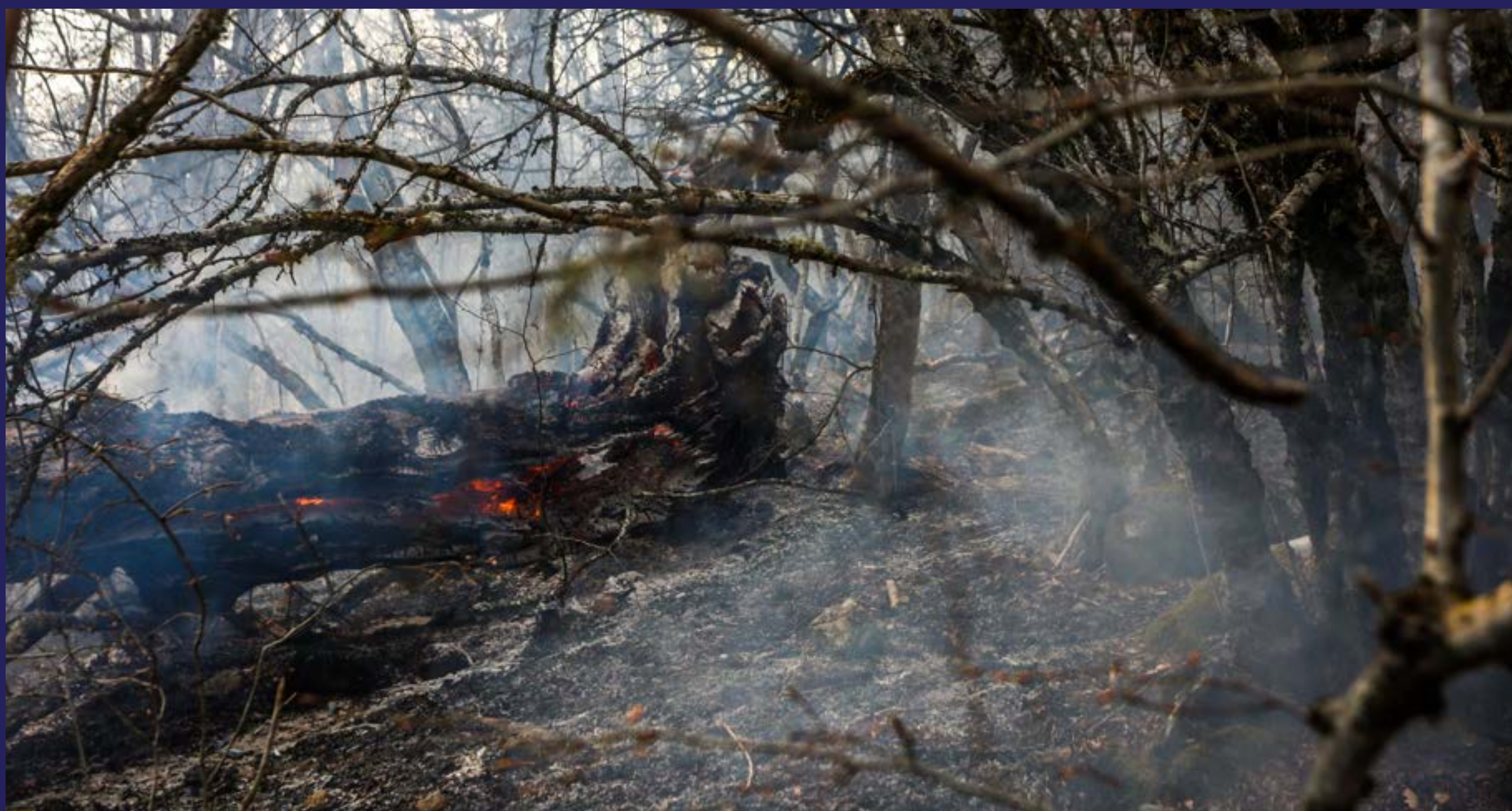
Vatrogasci tražili čizme a dobili metlarice (2020)