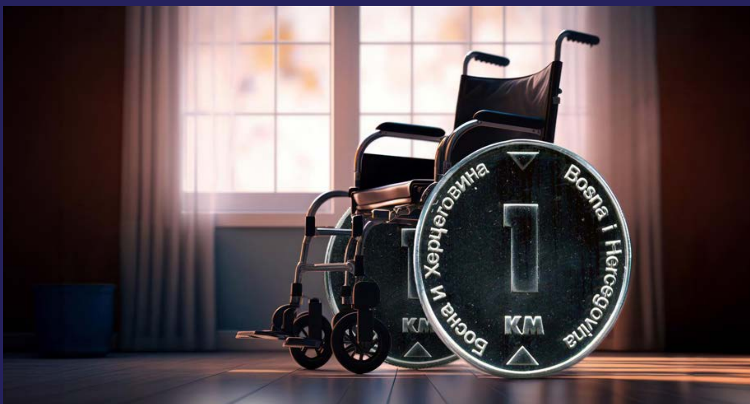
Milostinja osobama sa invaliditetom, zarada privatnicima (2024)