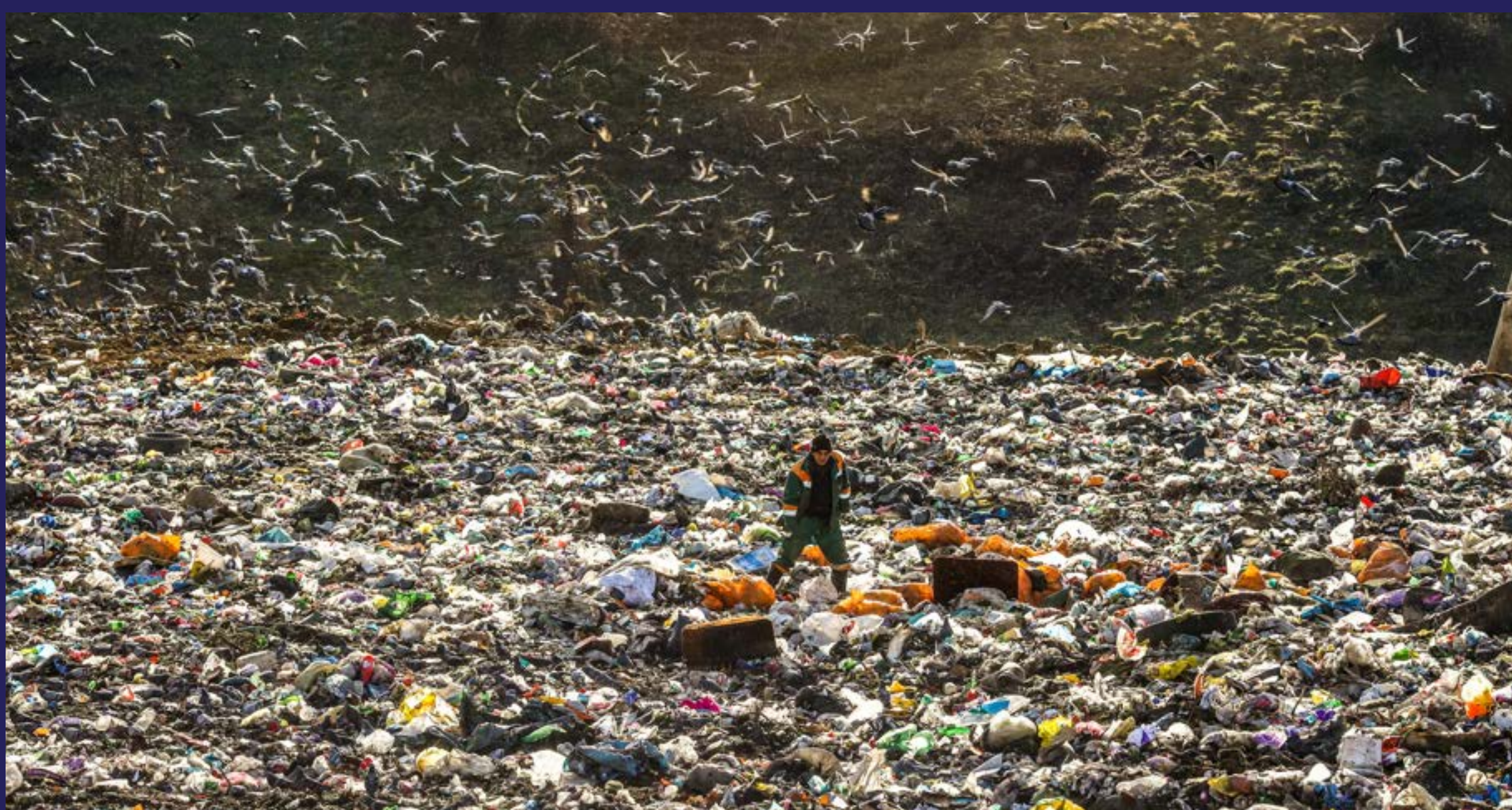
Uložili milione, dobili zagađenu vodu (2018)