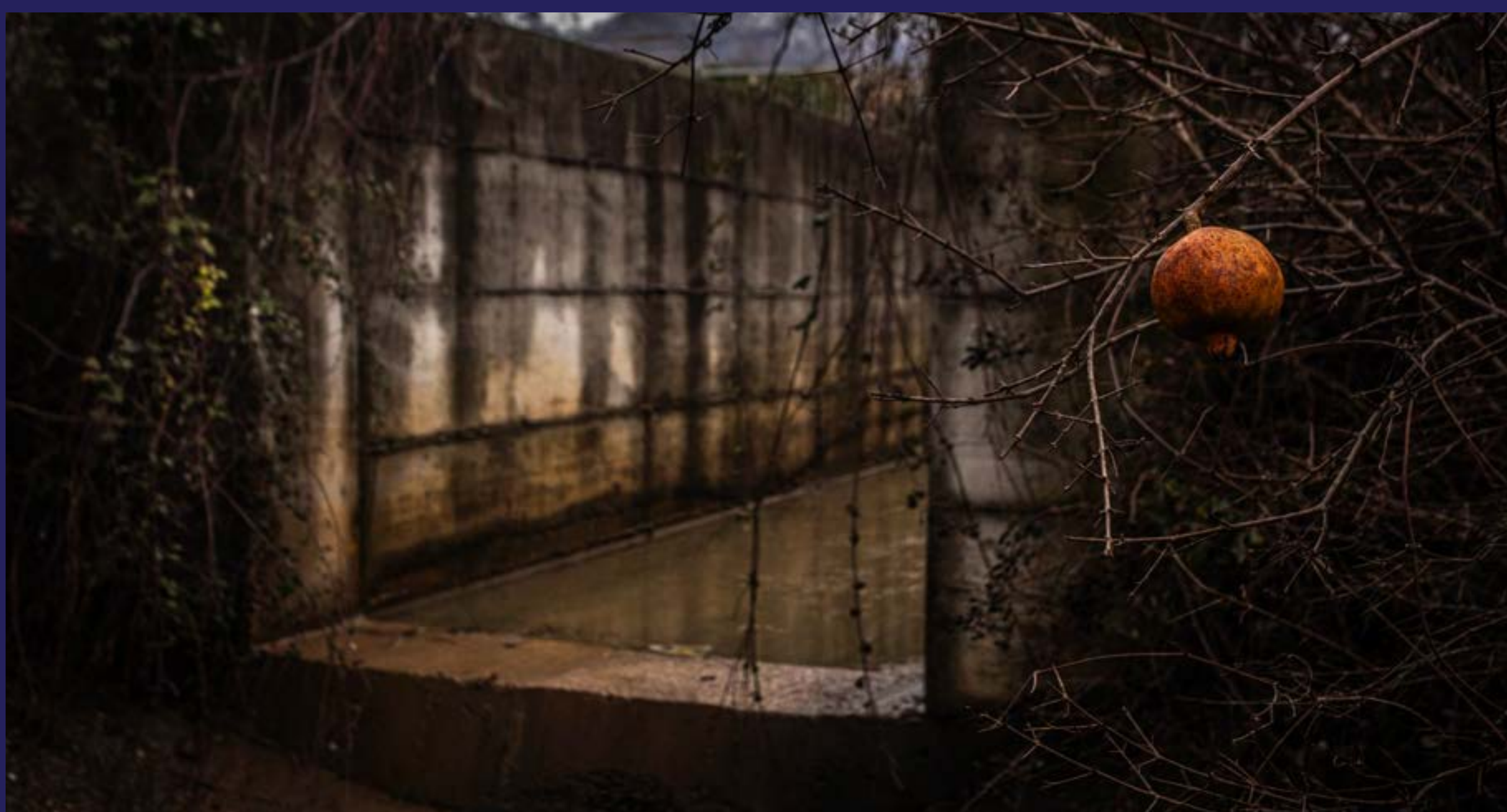
Kralj otrova curi iz mostarske deponije (2021)