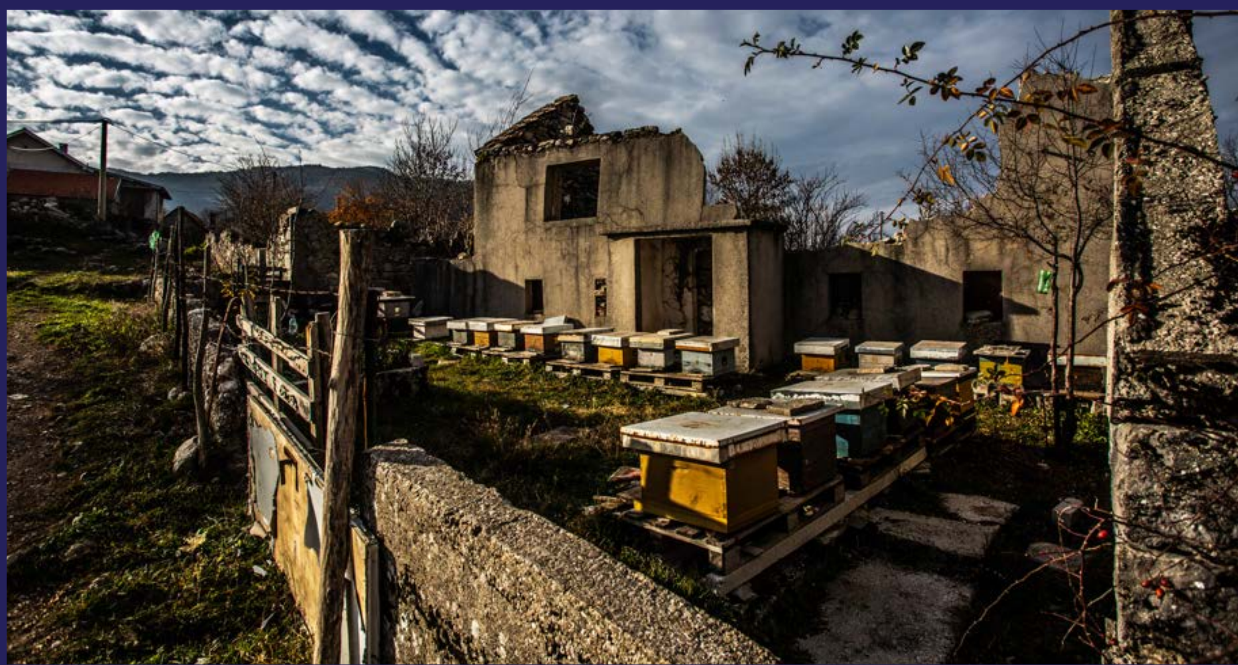
Godine čekanja na čistiji zrak (2015)