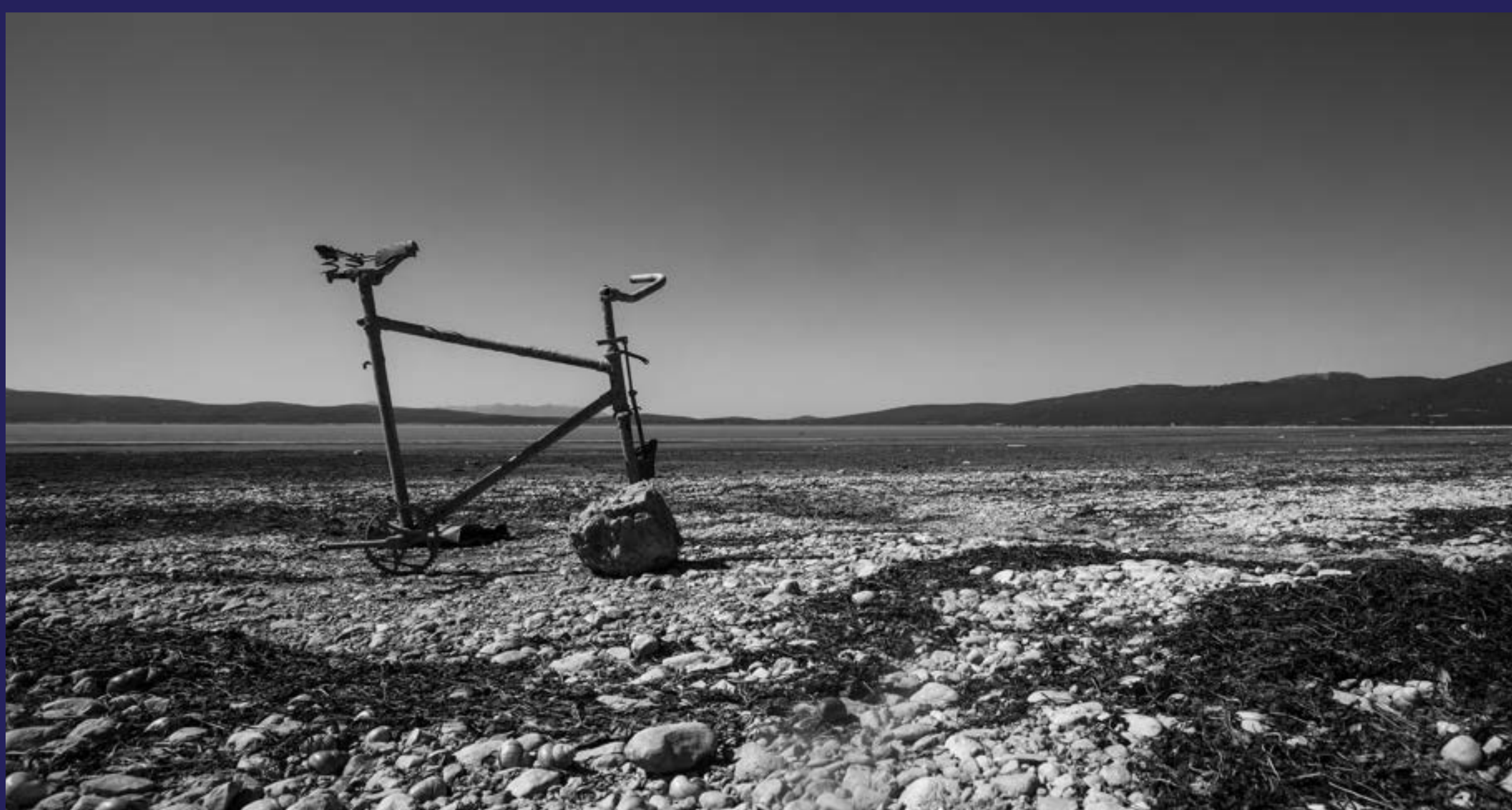
Zelena agenda (2022)