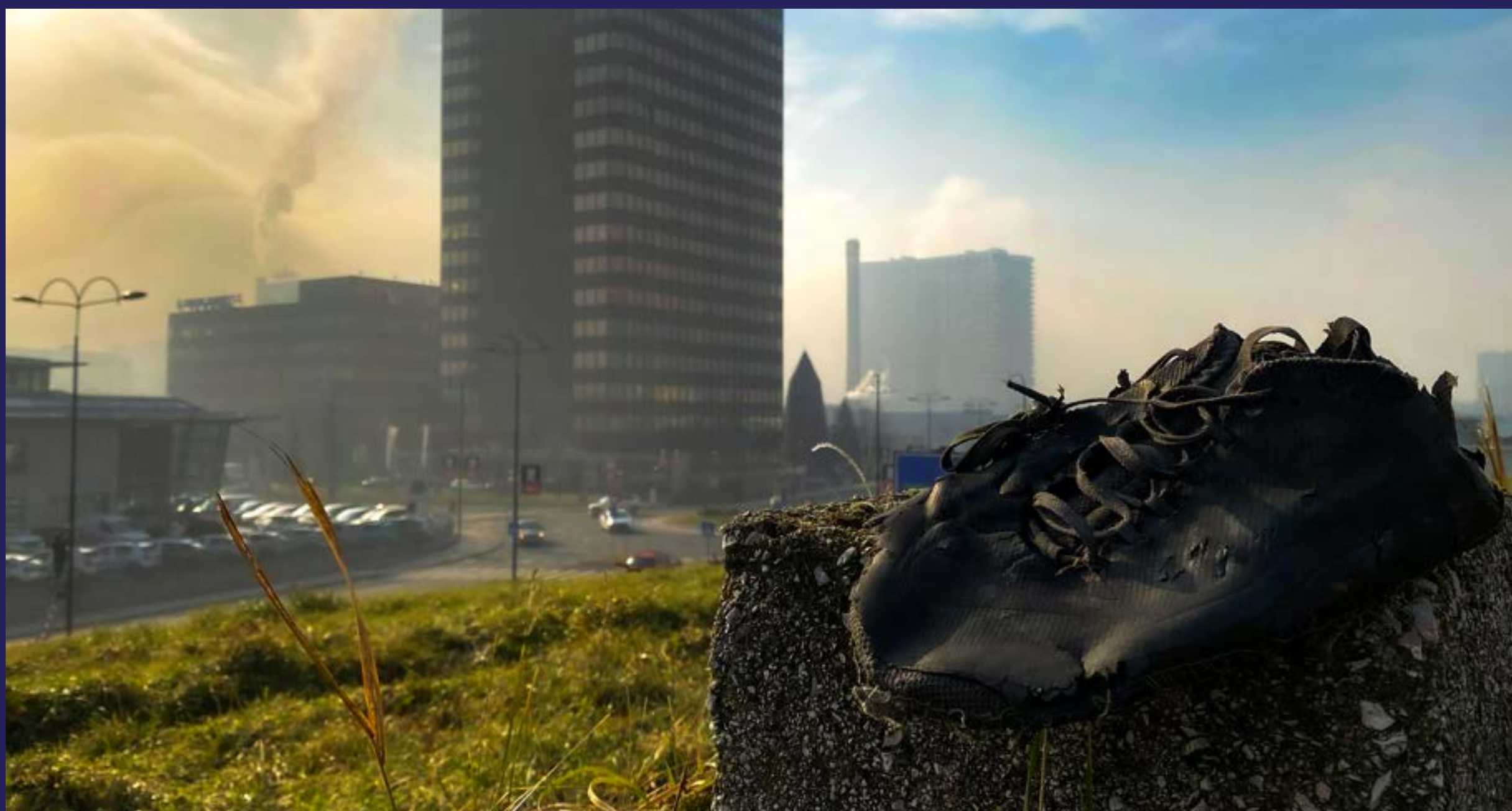
Milioni za komisije u federalnim ministarstvima (2023)