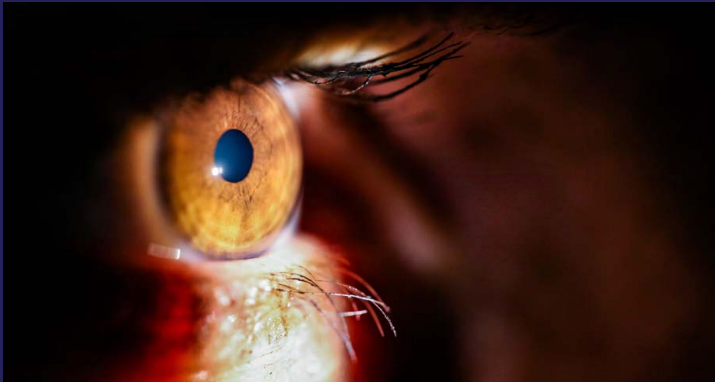
Prodaja leća preko pacijentovih pleća (2018)