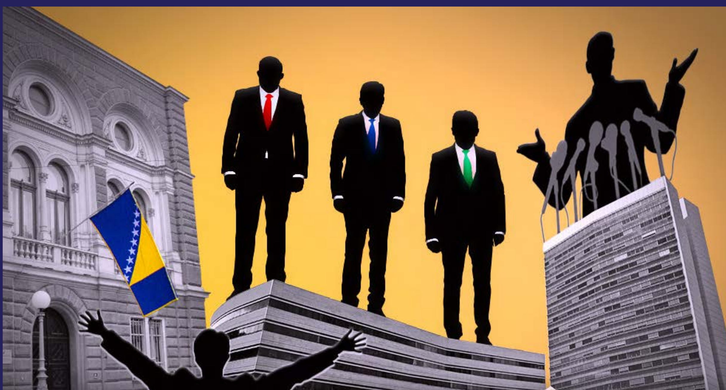
Mandat nerada skupo koštao građane (2022)