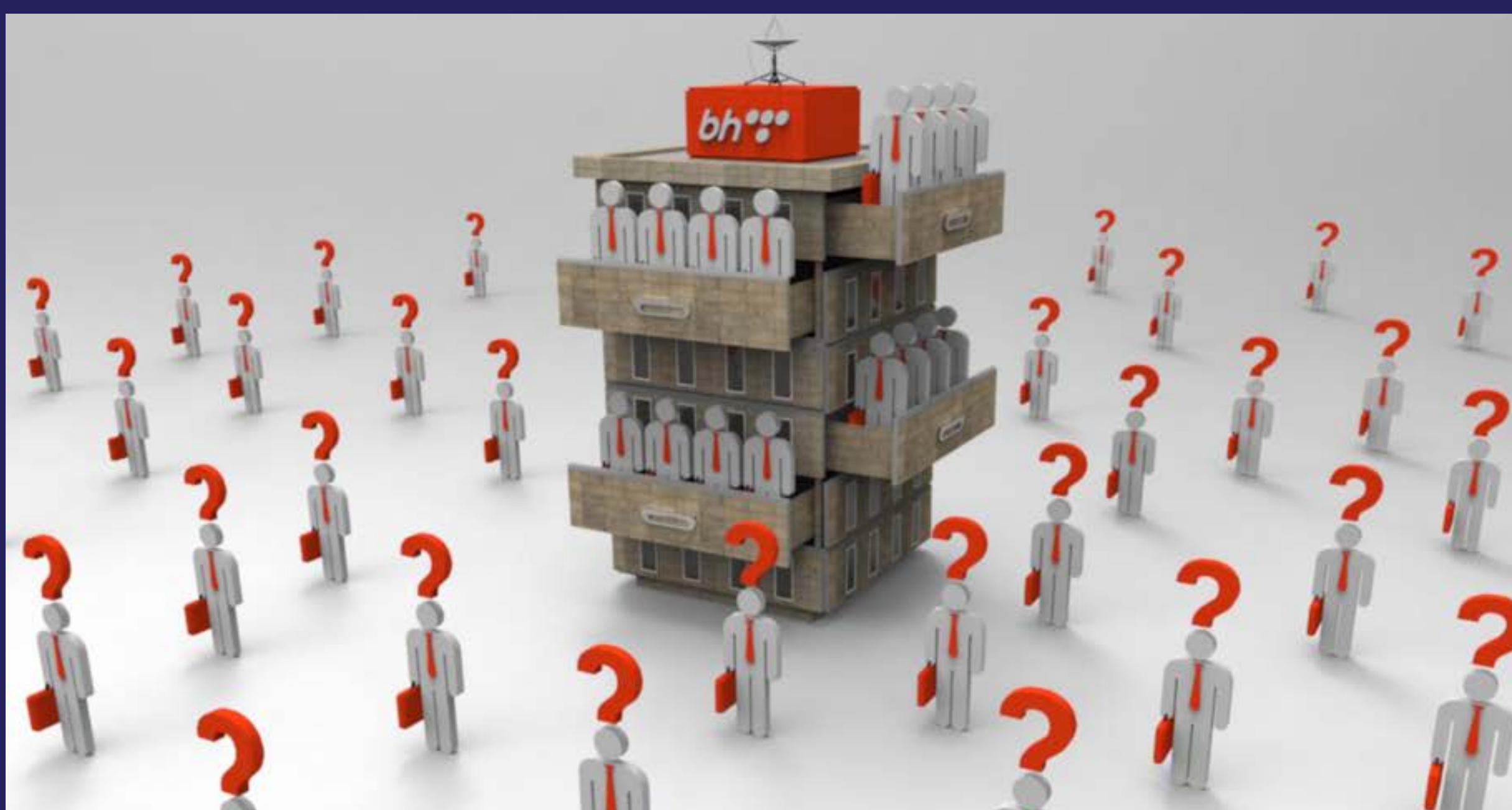
Tijesna koža BH Telecoma (2018)