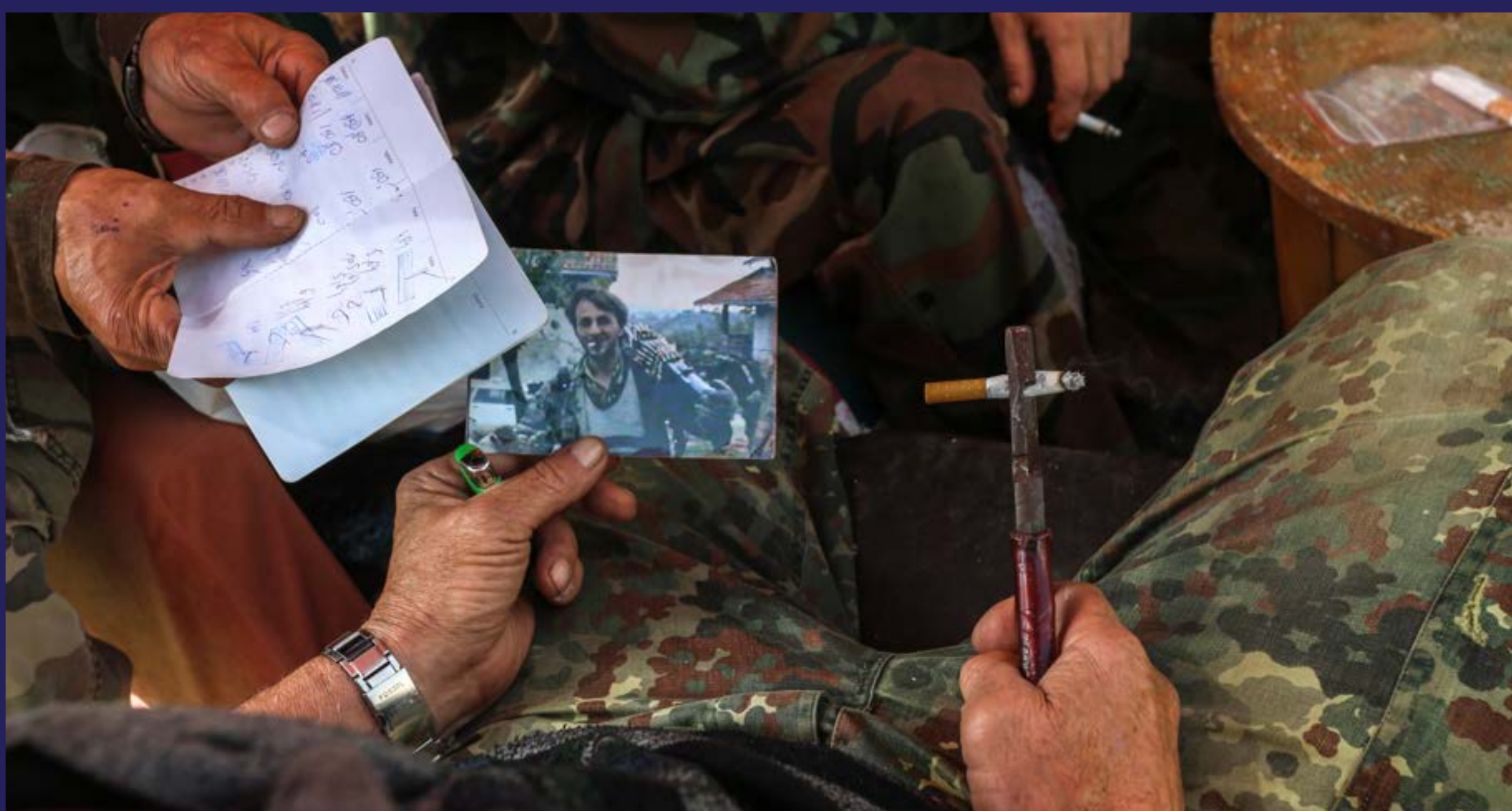
Keš predsjedniku, borcima mrvica (2018)