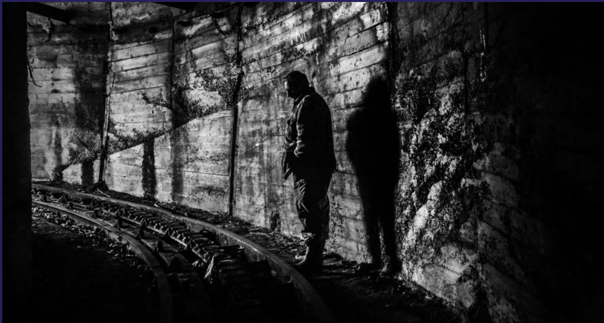
Lagerovanje koncesija (2021)