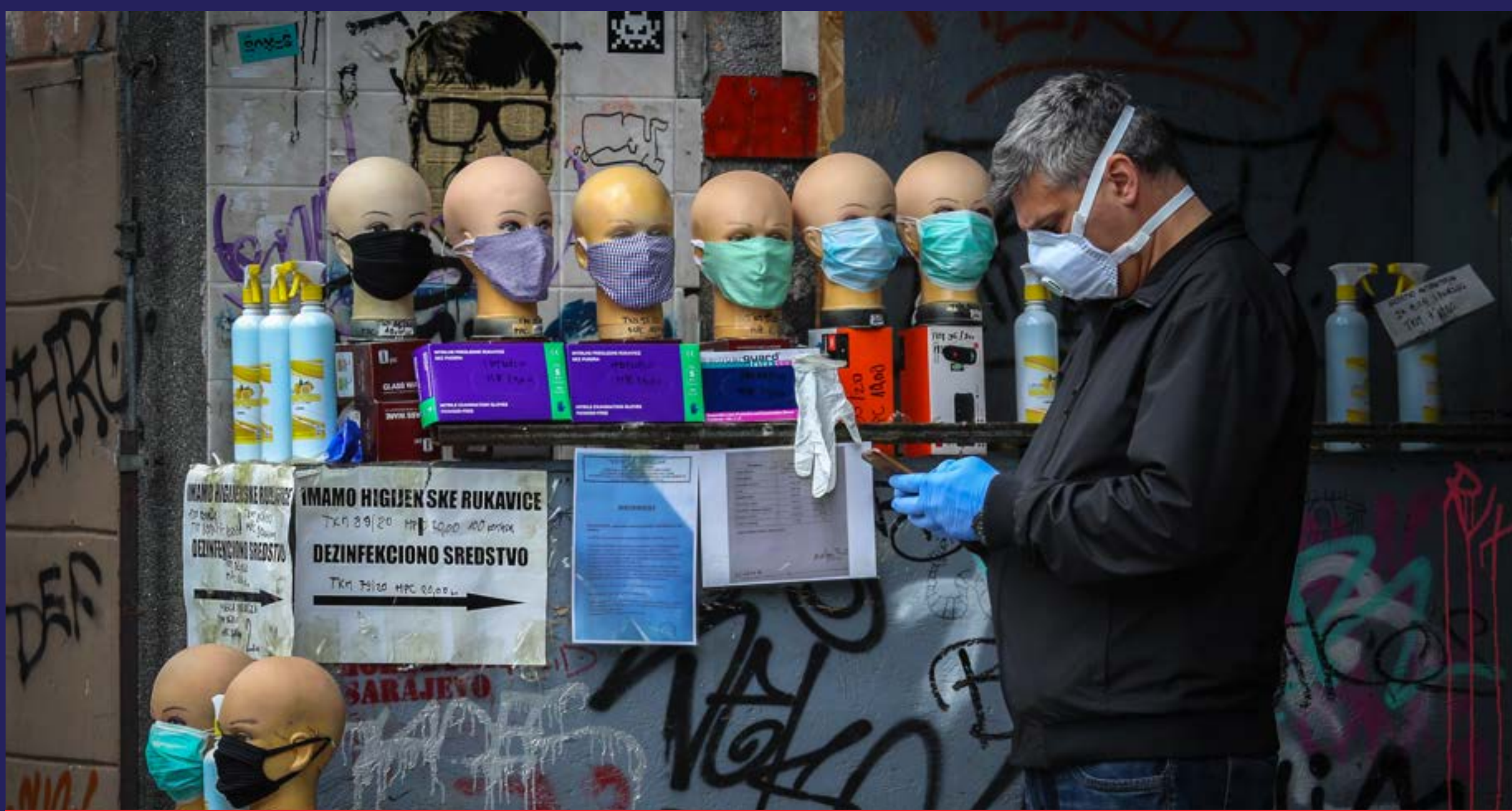
Bolnice na respiratoru (2020)