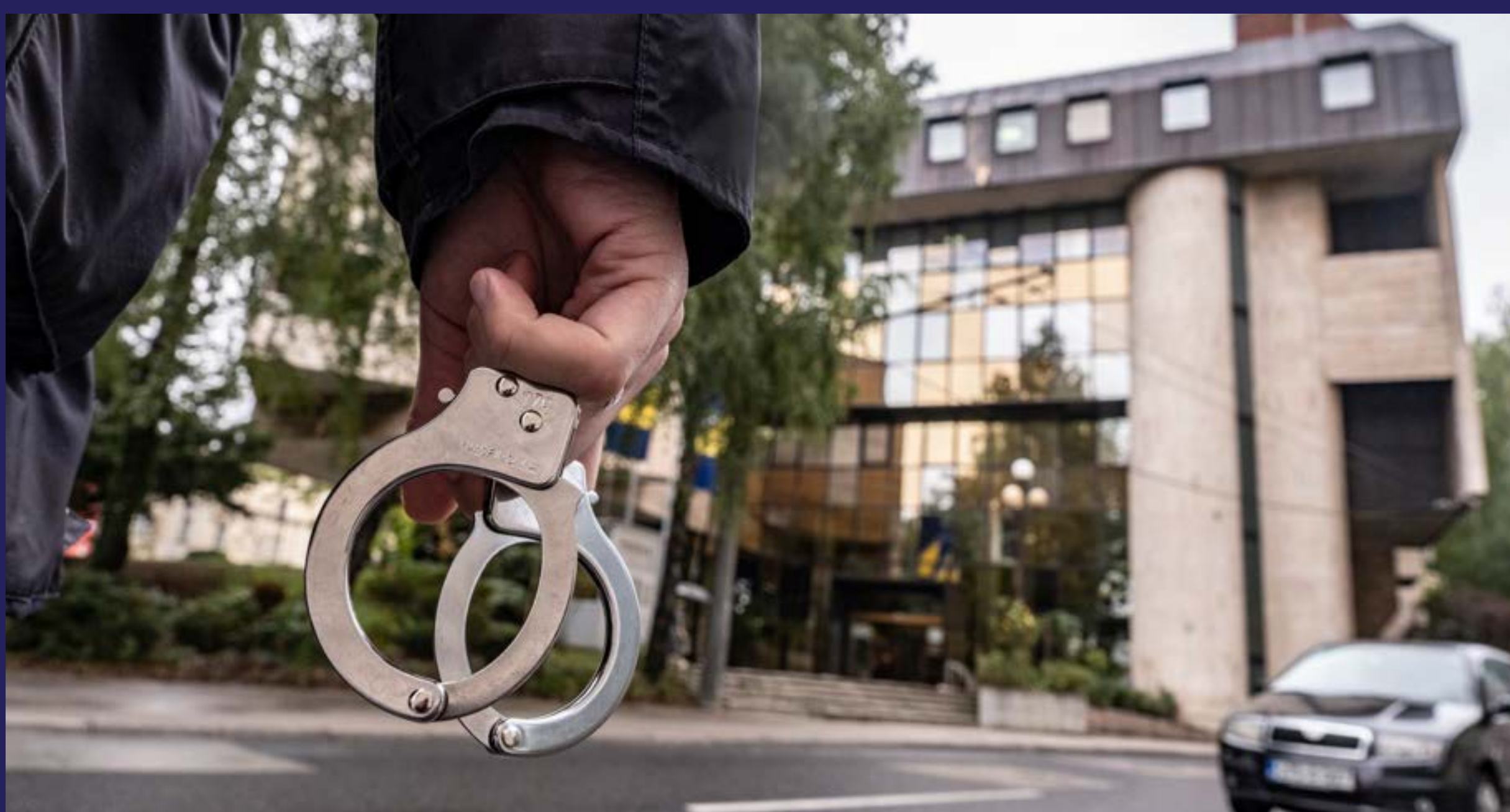
Zakonodavci s druge strane zakona (2021)