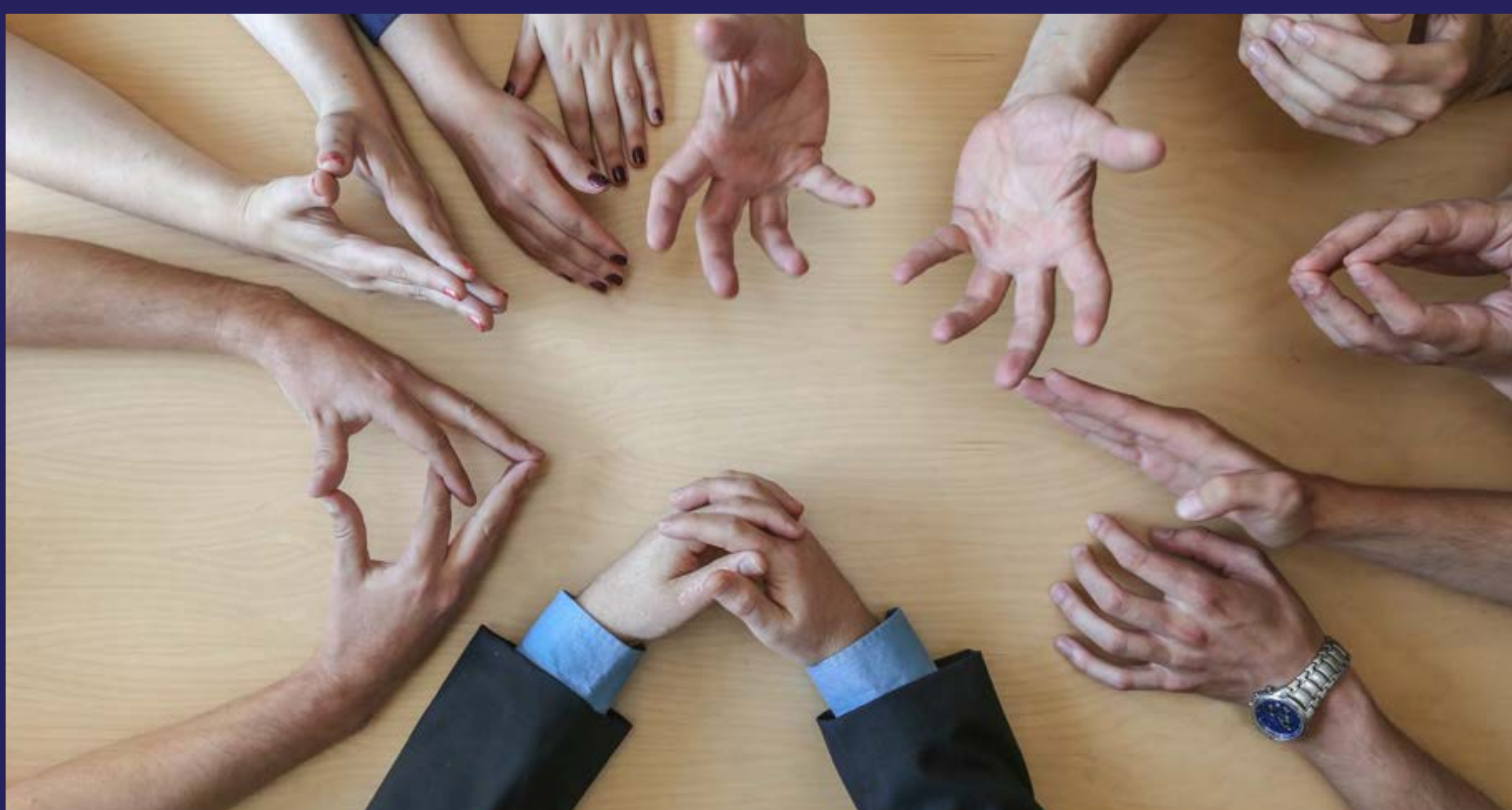
Sarajevski savjetnici važniji od zakona (2018)