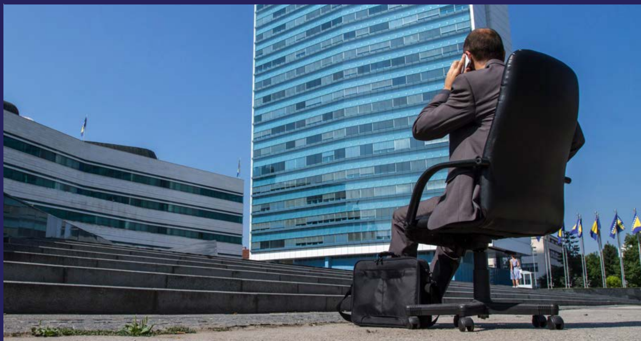
Funkcionerima isplaćeno 346 hiljada KM za otpremnine (2015)