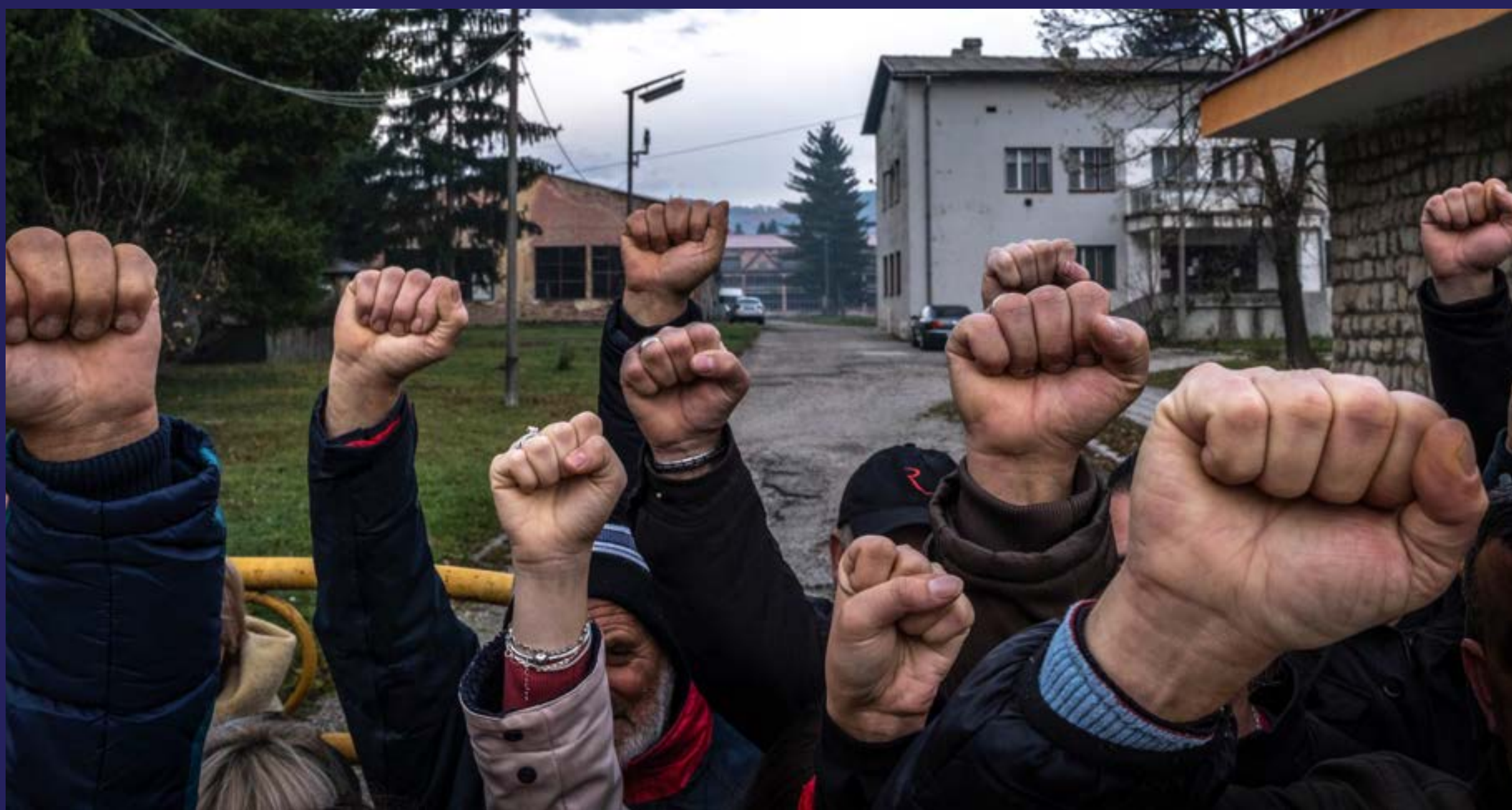
Raketnim bacačima na imovinu namjenske industrije (2022)