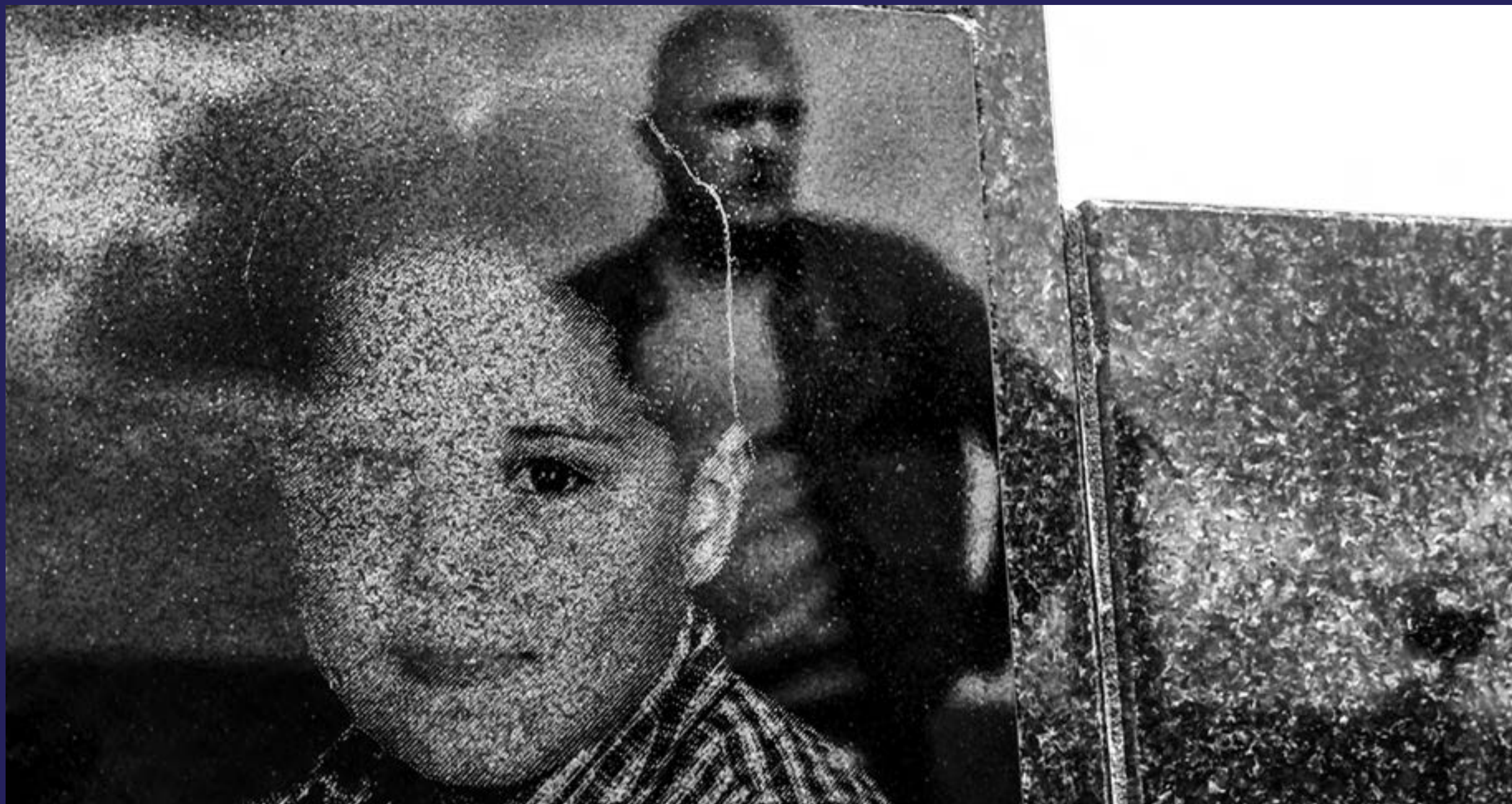
Korumpirani službenici jeftino kupuju slobodu (2019)