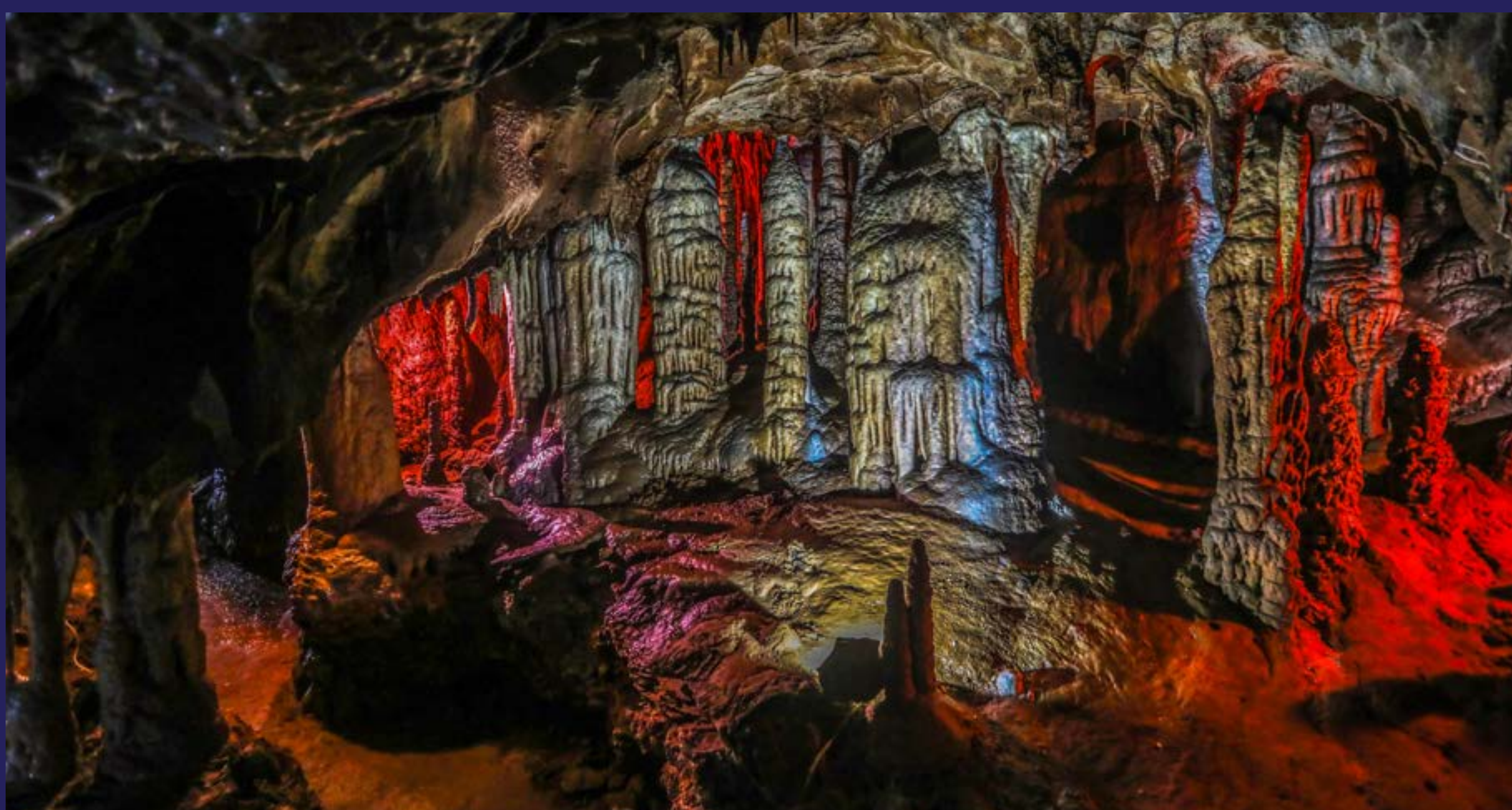
Zaštićena područja bez zaštite (2020)