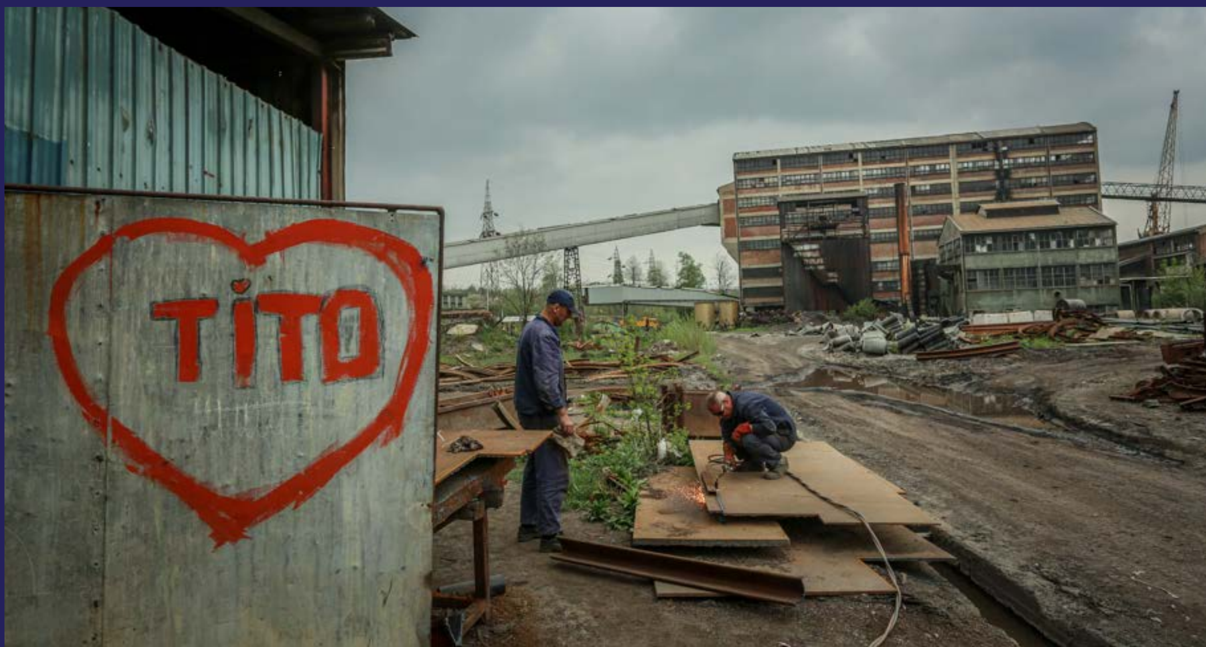
Namješten posao koštao rudnik milione (2018)