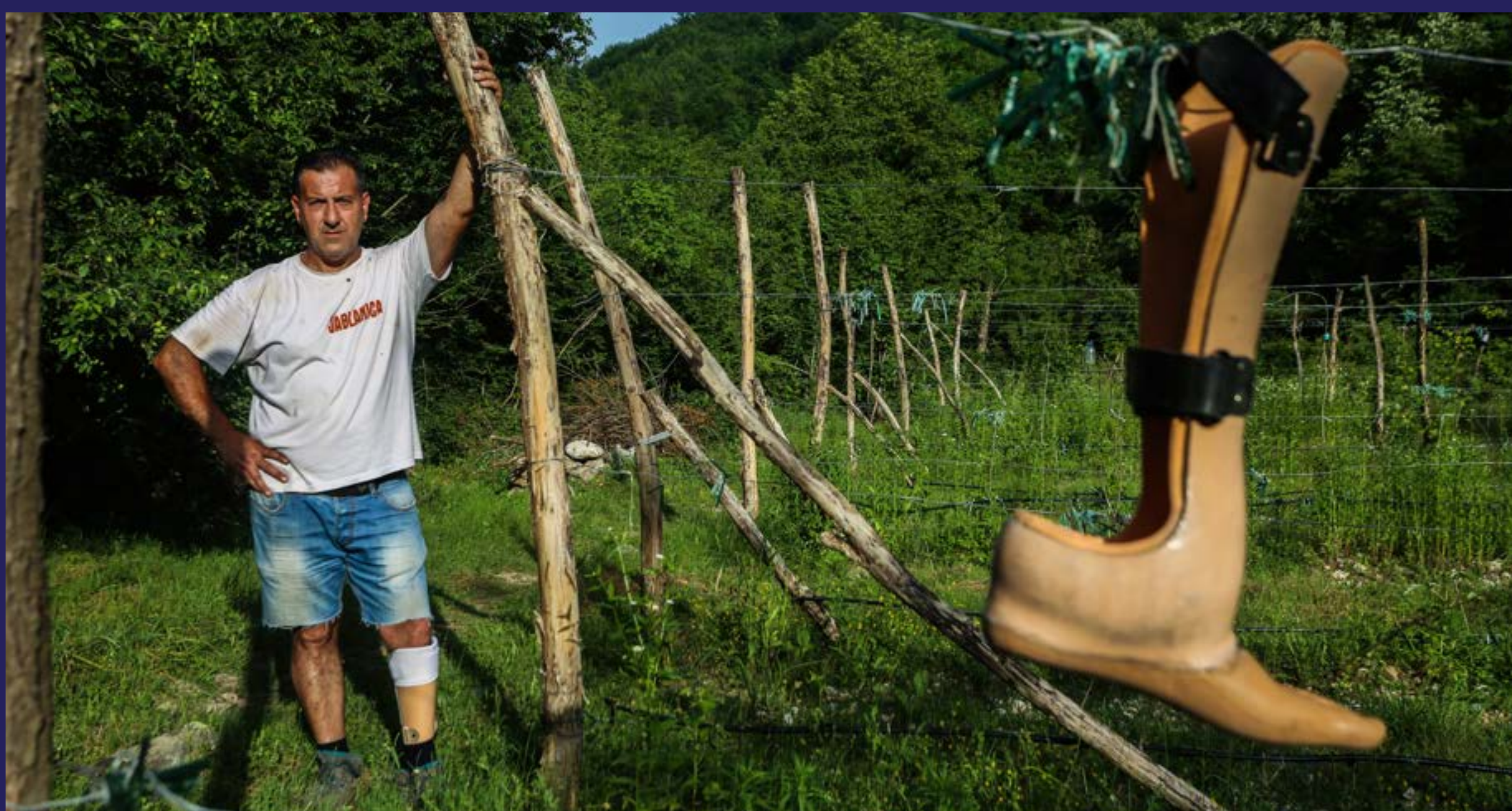
Građani faulirani na rijeci Doljanki (2019)