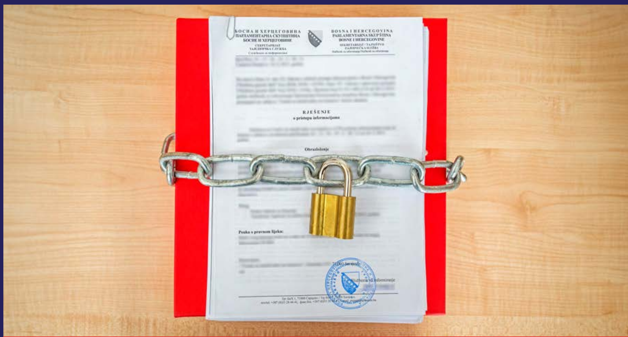
Odstupanje od slobodnog pristupa informacijama (2015)