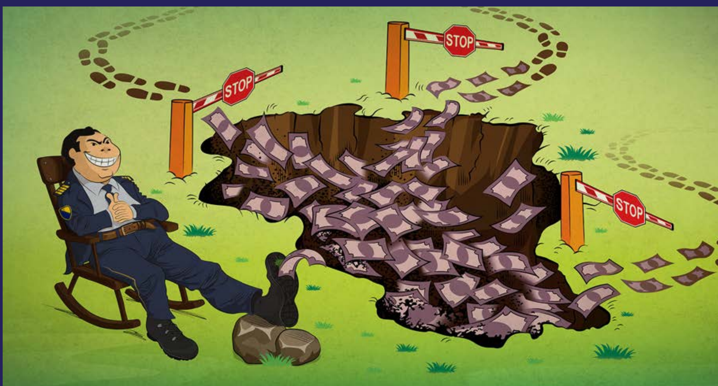
Keš curi kroz šuplje bh. granice (2021)