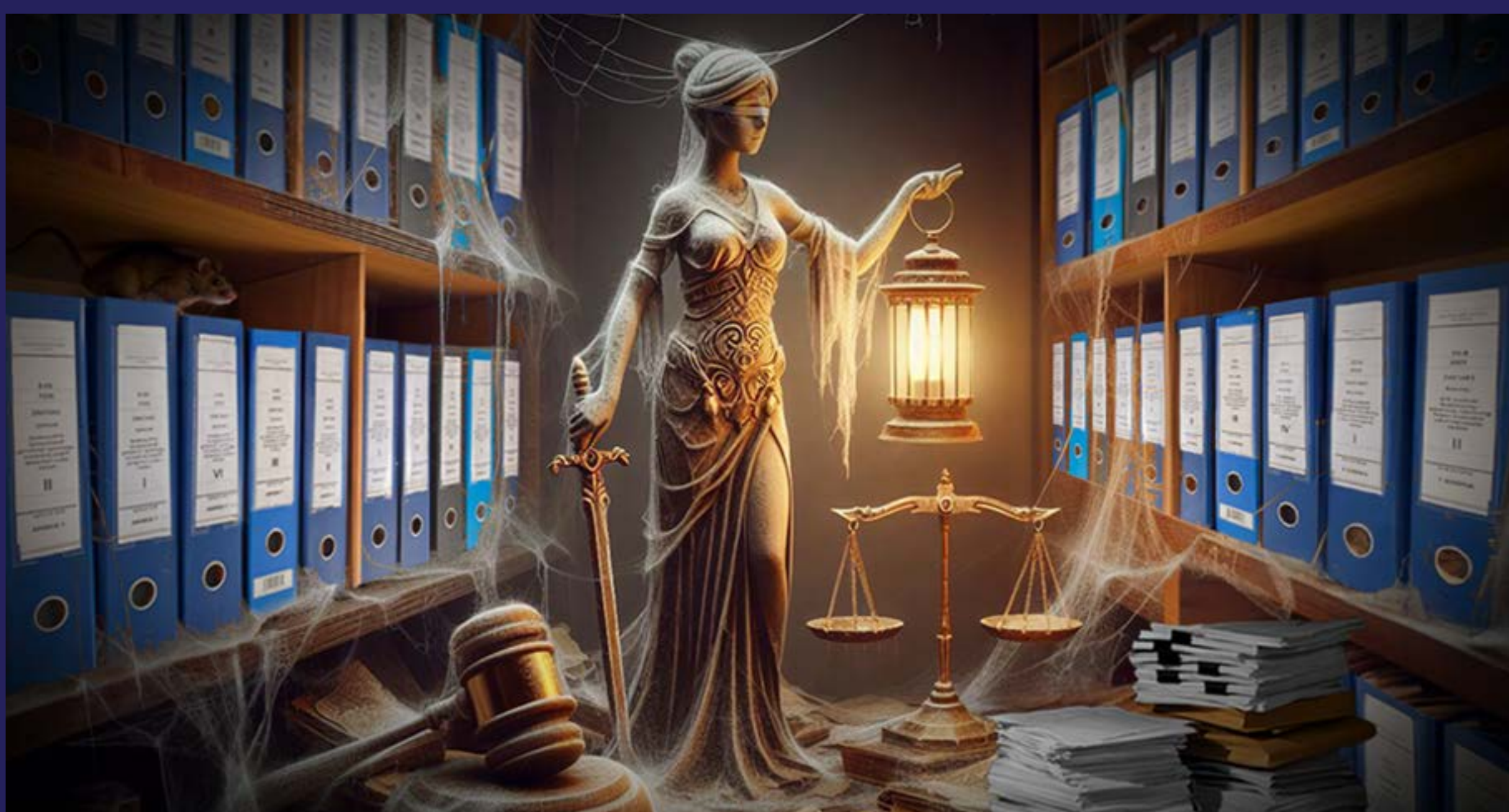
Sloboda osuđenicima, ukor sudijama (2024)